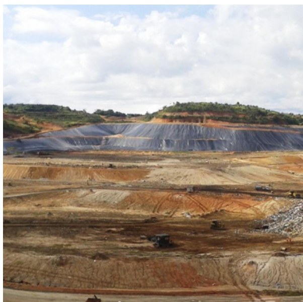
Aterro Sanitário

Os aterros sanitários, ao contrário dos lixões, são locais preparados para receber o lixo, pois possuem uma manta de plástico que protege o solo e evita sua contaminação, além de um sistema que não deixa poluir o ar e a água. Todo o lixo é enterrado e não atrai animais indesejados como o mosquito da dengue e ratos, entre outros.